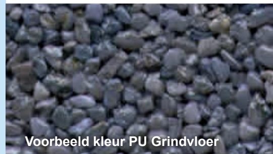
Voorbeeld kleur PU Grindvloer