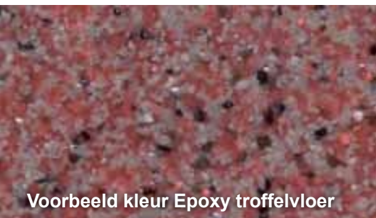
Voorbeeld kleur Epoxy troffelvloer