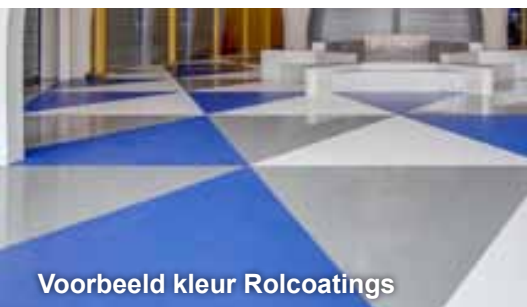
Voorbeeld kleur Rolcoatings