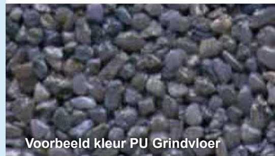
Voorbeeld kleur PU Grindvloer